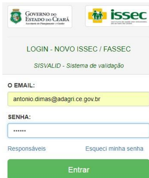
Figura 09. Lâmina de acesso ao Sistema de validação de proposta de adesão.

Ao acessar o Sistema o Validador Master, terá as seguintes opções de menu :